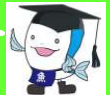
イメージキャラクター 「うおっち博士」