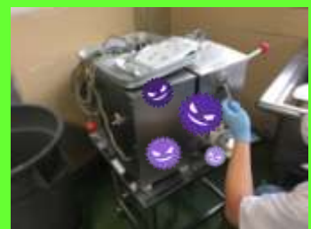
調理台・調理器具